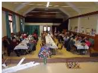
Vue de la « TOP » du 05 novembre 2016 à la salle de la MJC de Spechbach (nous étions 57) !

03 89 25 41 50 (centre interparoissial) ou au 06 21 08 29 31 (Bénédicte GREINER).